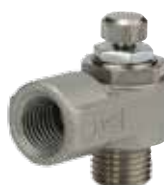
● スピードコントローラ